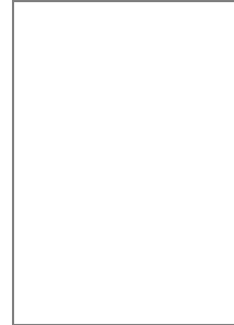
Huella dactilar Tomador (Pulgar derecho)